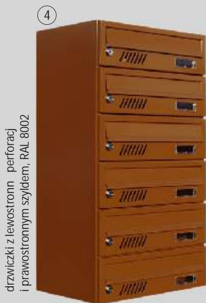
drzwiczki z lewostronną perforacją i prawostronnym szyldem, RAL 8002