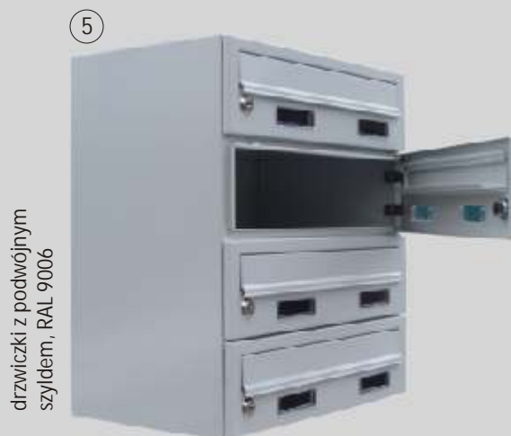
drzwiczki z podwójnym szyldem, RAL 9006