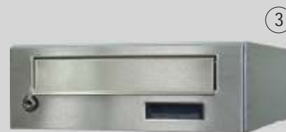
pojedyncza skrytka z drzwiami i klapką nierdzewnymi