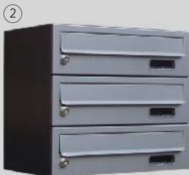
wersja z frontem wykonanym ze stali nierdzewnej, korpus malowany proszkowo

skrzynka 8 skrytkowa model PLx8: H_8 = 88 cm